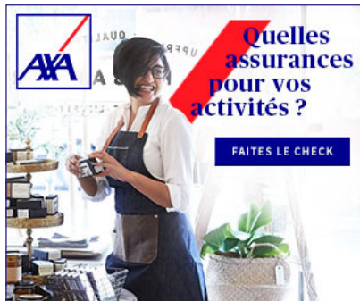
Format "Medium Rectangle – 300x250"

https://web.wcc.axa.be/wcc2/SiteCollectionDocuments/ibp/ma/banbox/2018-10-axa-checkup-pro-rectangle-fr.html